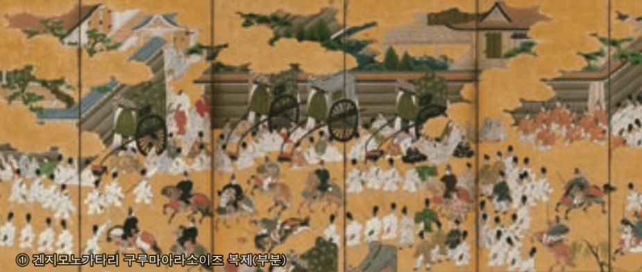
① 겐지모노가타리 구루마아라소이즈 복제(부분)